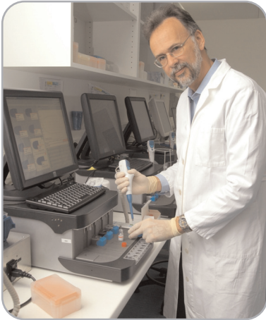
Alle führenden Manager bei Pentapharm nutzen MindManager für ihre Projektplanung.

„MindManager ist ein exzellentes Werkzeug für unsere Projekt- und Zeitplanung. Wir können damit komplizierte Zusammenhänge besser visualisieren und überschaubar machen.“